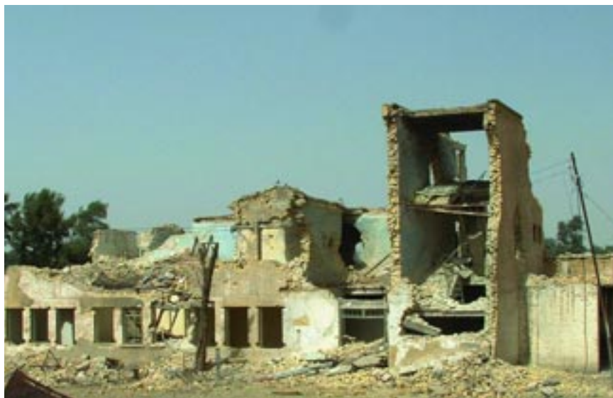
Un immeuble de Bagdad après un bombardement américano-britannique.