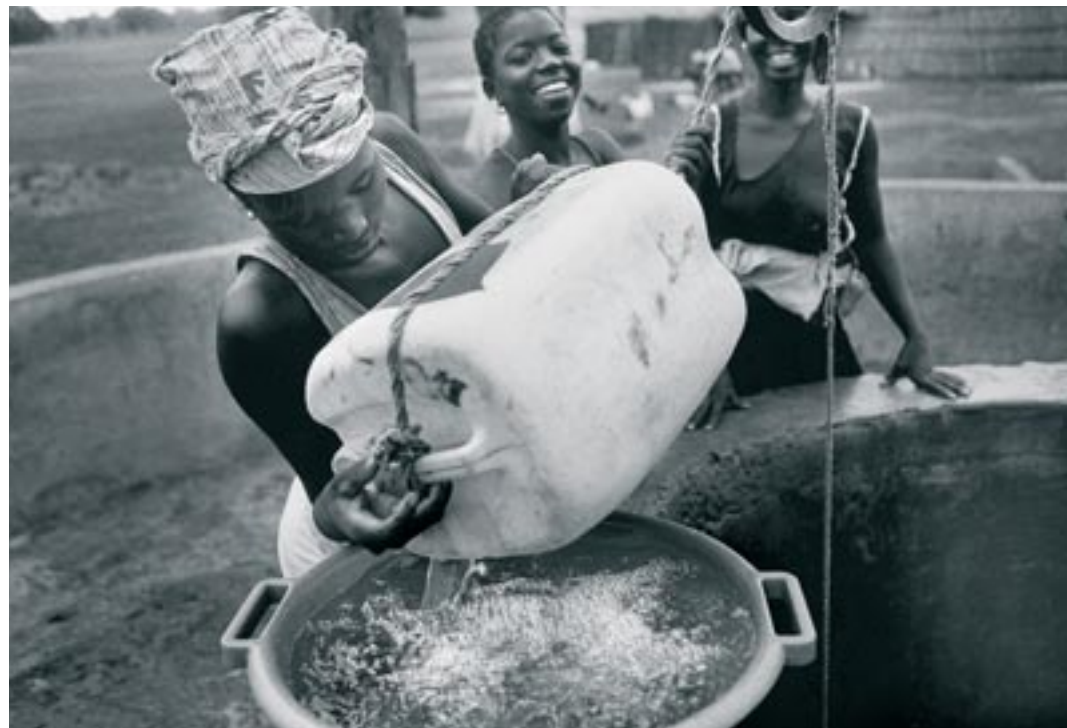
Femmes au bord d'un puits. Pour beaucoup, l'eau est devenue quasi impayable au Ghana.

immédiat de cette privatisation" explique Rudolf Amenga-Etago de l'ONG ghanéenne Integrated Social Development Center, "a été une forte hausse des tarifs. Le mètre cube d'eau est passé de 0,10 dollars en 1998 à 0,75 dollars aujourd'hui. Or, la plupart des Ghanéens gagnent moins de 2 dollars par jour. Le salaire minimum est de 1 dollar par jour, ce que beaucoup de travailleurs ne touchent même pas". Les conséquences sont dramatiques. "Je connais une femme du quartier Mamobi dans la capitale Accra" poursuit Rudolf. "Pour elle, l'eau potable est tout simplement impayable. Elle puise l'eau d'une source contaminée et la filtre avec un tissu. A Accra, le nombre de cas de choléra ne cesse d'augmenter. Les femmes et les enfants sont les premières victimes de cette privatisation. Les