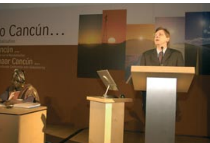
La société civile surveillera le futur gouvernement avant, pendant et après la conférence de l'OMC.

La conférence ministérielle de l'OMC à Cancun aura lieu début septembre. D'ici là, notre pays connaîtra des élections et la formation d'un nouveau gouvernement. L'occasion pour les mouvements sociaux et les ONG d'interpeller le formateur