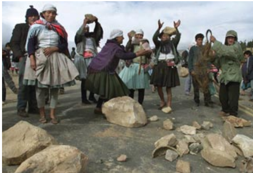
La résistance de la population de Cochabamba a porté ses fruits...

Début avril 2000, des milliers de Boliviens marchent sur la ville de Cochabamba, y déclenchent une grève générale et un blocage des transports. On brûle les factures d'eau. Ces manifestations sont sévèrement réprimées : on compte un mort (un jeune de 17 ans) et 175 blessés. Ces événements diffusés à la télévision provoquent un soulèvement général. Des troubles graves éclatent dans cinq départements. Dans plusieurs villes des policiers, mal payés, refusent d'obéir aux ordres. Parallèlement, un travail parlementaire est lancé pour mo-