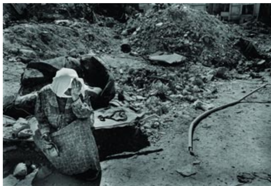
Dans la ville de Jénine dévastée, avril 2002.

abstentions (Australie, Costa Rica) et une voix contre (Etats-Unis).