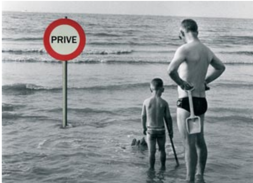
Si on n'y prend garde, tout, le solide comme le liquide, tout sera à vendre et à acheter.

La conférence ministérielle de l'Organisation mondiale du commerce (OMC) de Doha (novembre 2001) a donné une impulsion extrêmement forte à ce processus. Sur proposition de l'UE,