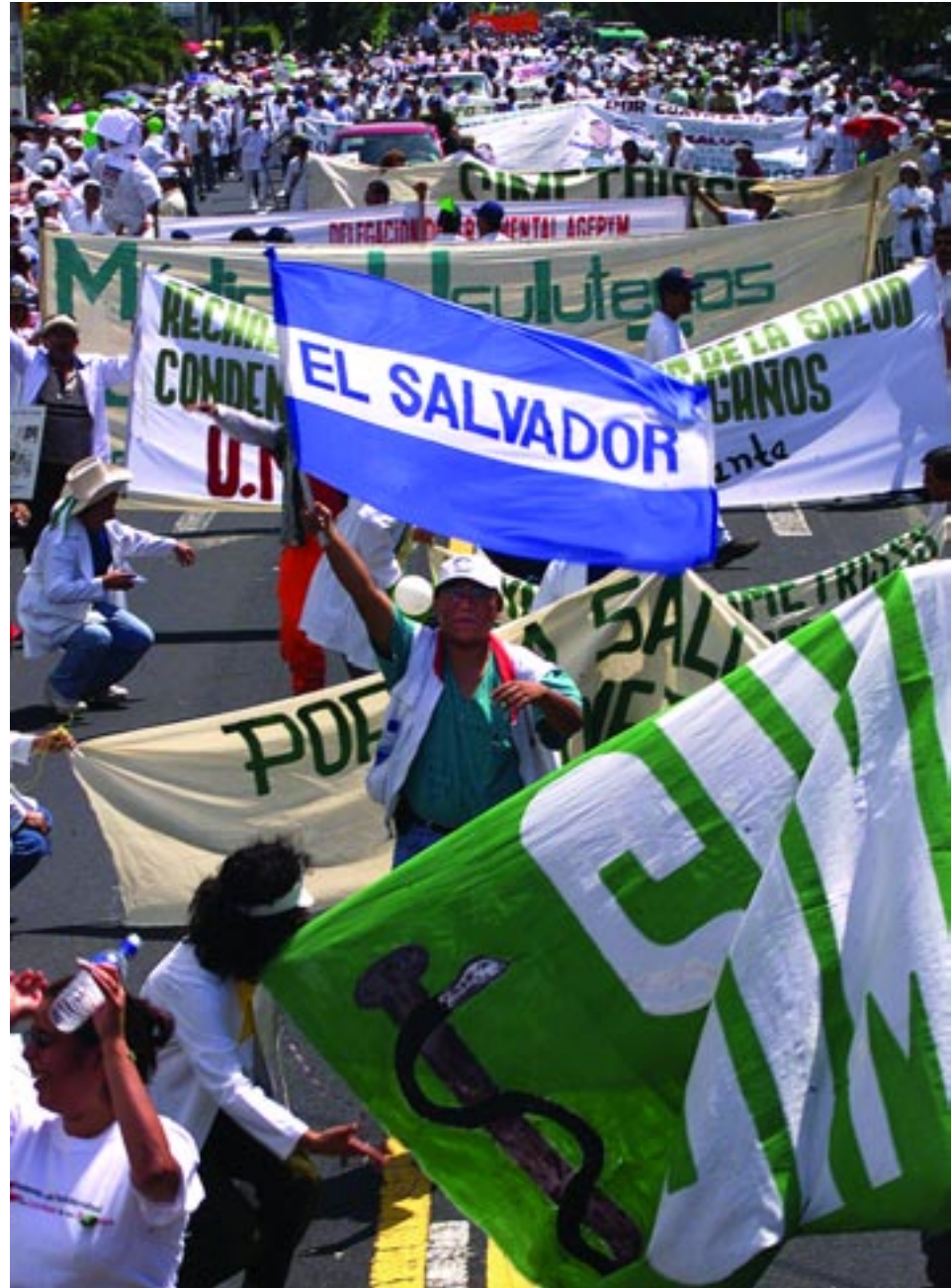
Des milliers de manifestants dans les rues de la capitale San Salvador pour la défense des services publics.

L'eau est devenue un enjeu majeur. "Elle est encore plus essentielle que les autres services. On touche ici à la vie elle-même. Petit à petit se créent en coulisses les