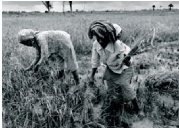
Les subventions européennes à l'agriculture ont des répercussions sur les pays en développement.

Les négociations sur la libéralisation des marchés agricoles à l'OMC sont dans l'impasse. Loin de se soucier d'un mode de production agricole qui réponde réellement aux besoins des populations du Nord et du Sud, les négociations sont plutôt une foire d'empoigne d'intérêts particuliers nationaux pour la maîtrise des marchés et pour renforcer leur compétitivité internationale. Le terrain se prépare pour que la compétition entre agriculteurs devienne de plus en plus dure et inégale.