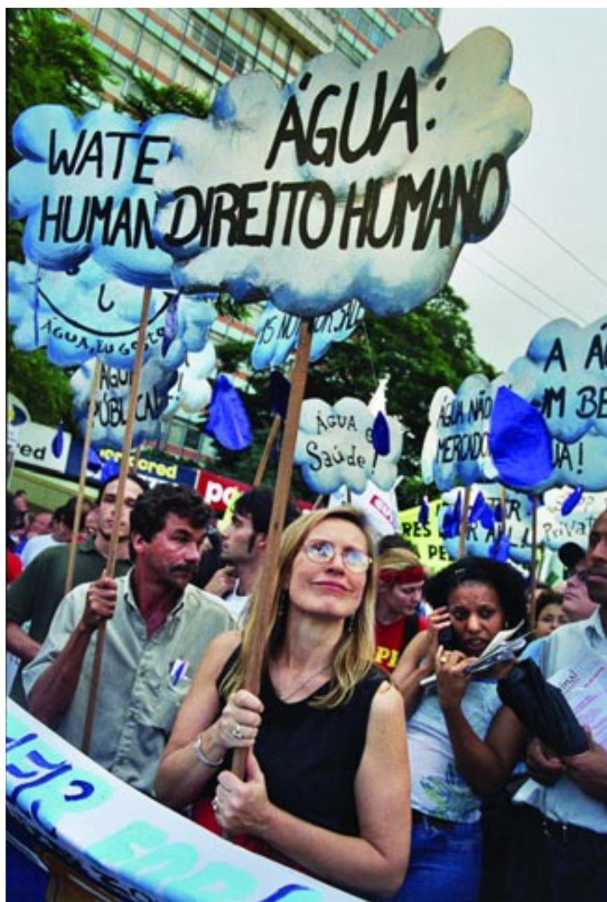
Manifestation pour le droit à l'eau potable lors du troisième Forum social mondial de Porto Alegre (janvier 2003).

Deuxième principe : l'eau est un bien commun de l'humanité. Ce concept, défini par l'économiste Riccardo Petrella, définit l'eau comme propriété de tous les êtres humains et de toutes les espèces vivantes de la planète. La quantité de l'eau disponible étant limitée, elle ne peut être laissée aux mains d'entreprises privées motivées par le profit. Dès lors, "la propriété, la gestion et le contrôle politique de l'eau doivent être et rester publics, sous la responsabilité directe des pouvoirs publics". Pour cela, la ges-