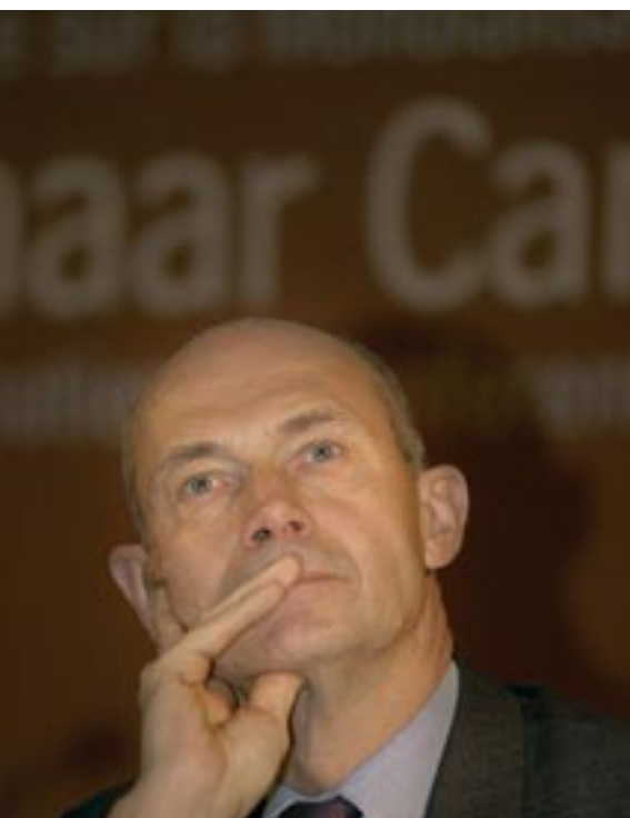
Le Commissaire Pascal Lamy, fervant partisan de la privatisation des services.

Signé pour la première fois en 1994, l'Accord Général sur le Commerce des Services est l'un des accords les plus importants au sein de l'Organisation mondiale du commerce (OMC). L'AGCS n'est pas un accord de commerce dans le sens traditionnel car il touche aux fondements de notre société. Il place tout le monde devant les choix suivants : accepterons-nous à l'avenir que les services publics (enseignement, soins de santé, distribution d'eau, poste, transports, culture, patrimoine, gestion de l'environnement...) soient tous sous l'emprise de la logique commerciale? Et laisserons-nous l'industrie des services et les experts commerciaux prendre toutes les décisions à ce sujet?