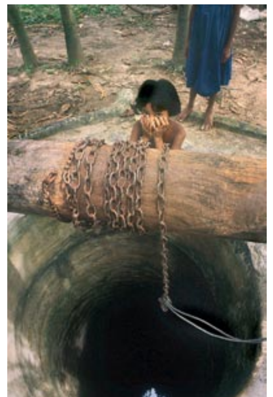
Le secteur revendique une coopération au développement nationale et unie.