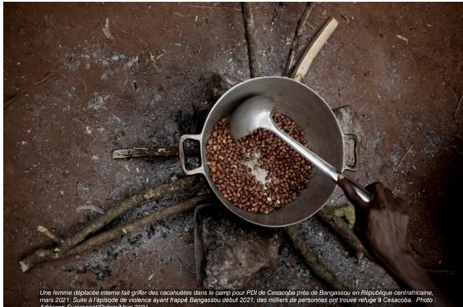
Une femme déplacée interne fait griller des cacahuètes dans le camp pour PDI de Cesacoba près de Bangassou en République centrafricaine, mars 2021. Suite à l'épisode de violence ayant frappé Bangassou début 2021, des milliers de personnes ont trouvé refuge à Cesacoba.

Un an et demi après le début de la pandémie, les décès imputables à la faim dépassent ceux dus au virus 1 . Les conflits en cours alliés aux bouleversements économiques provoqués par la pandémie et à une crise climatique qui s'accélère aggravent la pauvreté et l'insécurité alimentaire dans les foyers de faim extrême de par le monde et établissent des bastions dans les nouveaux épicentres de la faim.